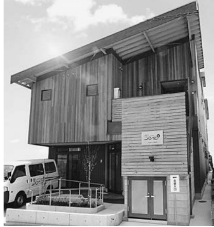
写真4 クリエイティブハウスパンジーⅢ

している。強度行動障害のある当事者も、時間をかけてハンガーの組み立てなどの仕事ができるようになっていく。白い無機質な壁に