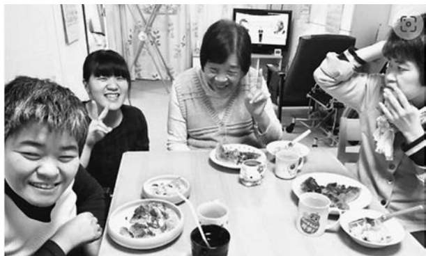
写真5 創思苑グループホームの暮らし

することができなかつた人も、グループホームに住んで徐々に落ち着いて生活できるようになっている。その行動がどのような時に、なぜ起きるのかを見極めることで解決の糸口がつかめる。ある当事者には「大丈夫？」と声をかけると落ち着くことがわかり、不安な気持ちや背景にあることがわかった。そこで、知恵を出し合って、落ち着いて暮らせる環境を作っていた。