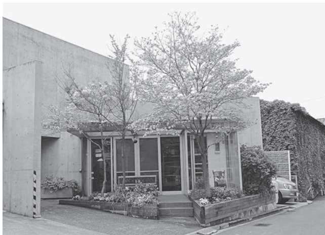
写真1 クリエイティブハウス パンジー (写真提供・社会福祉法人 創思苑)