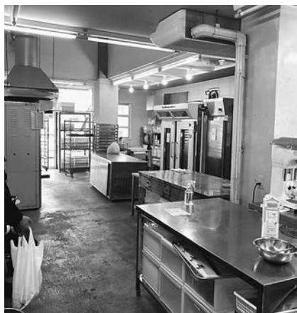
写真2 クリエイティブハウスパンジーのパン工房

パンジーでは軽作業も行っており、ガラス窓越しに見える小さな庭の奥にそのスペースがある。ここでは、スキルを身につけるといふよりは、その人なりの関わり方を見つけて一緒に作業ができるような関係づくりを目指