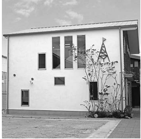
写真3 パンジーメディア